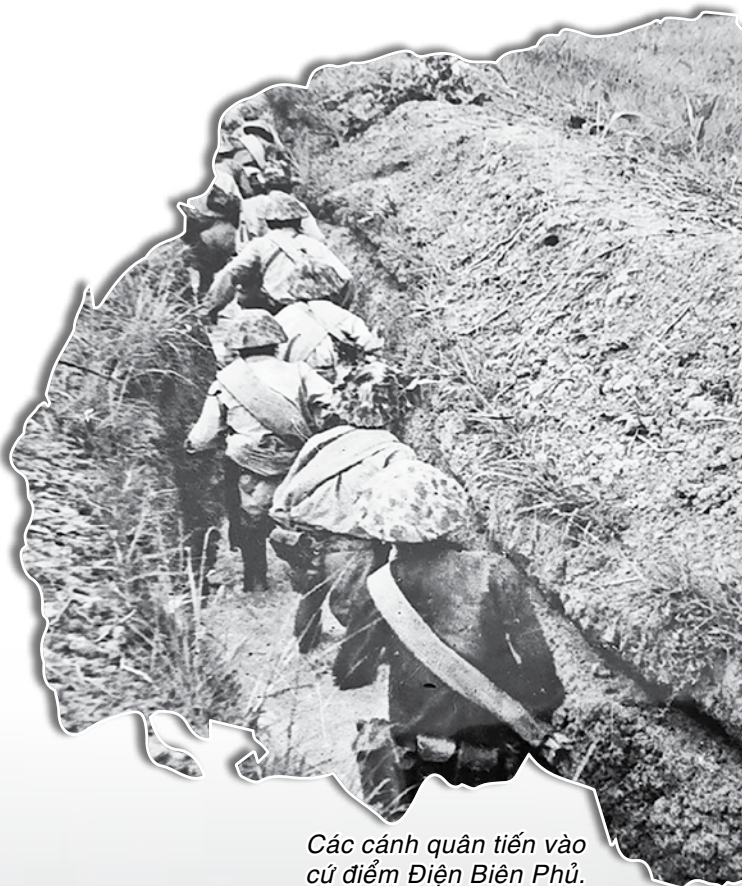
Các cánh quân tiến vào cứ điểm Điện Biên Phủ.

Tháng 11/1953, Nava cho quân nhảy dù xuống Điện Biên Phủ, xây dựng nơi này thành tập đoàn cứ điểm mạnh nhất Đông Dương - xương sống của “Kế hoạch Nava”. Lực lượng của địch ở đây lên tới 16.000 quân cùng nhiều vũ khí hiện đại, nhằm làm bàn đạp chiếm lại Tây Bắc, khống chế chiến trường Lào, đồng thời giữ quân chủ lực ta ở Việt Bắc để quân Pháp rảnh tay hoạt động ở