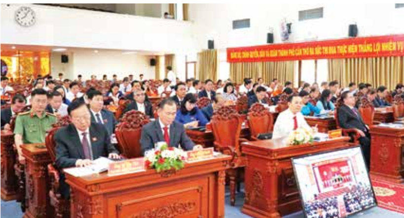
Lãnh đạo thành phố và các đại biểu dự kỳ họp.