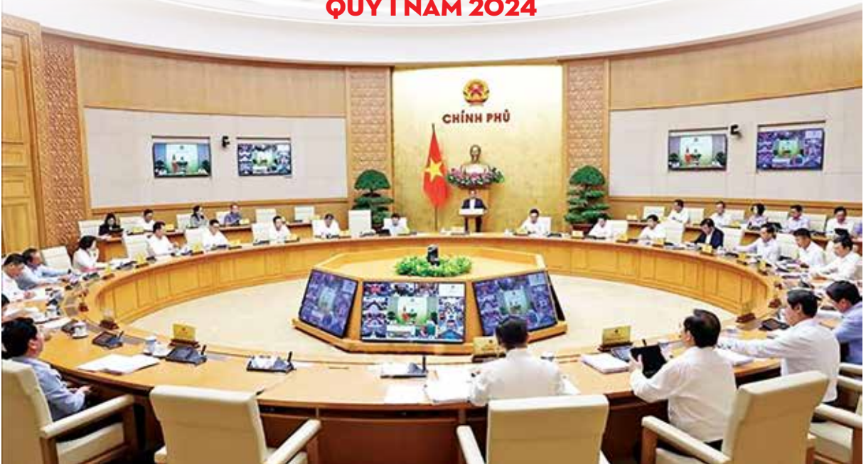
Thủ tướng Phạm Minh Chính chủ trì phiên họp Chính phủ thường kỳ tháng 3 năm 2024 và Hội nghị Chính phủ với địa phương.

Trong những tháng đầu năm 2024, các ngành, các cấp từ Trung ương đến địa phương đã quyết liệt thực hiện đồng bộ nhiều giải pháp theo chỉ đạo của Chính phủ về phát triển kinh tế - xã hội và đã đạt được một số kết quả mục tiêu quan trọng của kế hoạch sản xuất, kinh doanh năm 2024. Trong đó, có một số điểm sáng về kinh tế - xã hội, cụ thể là: