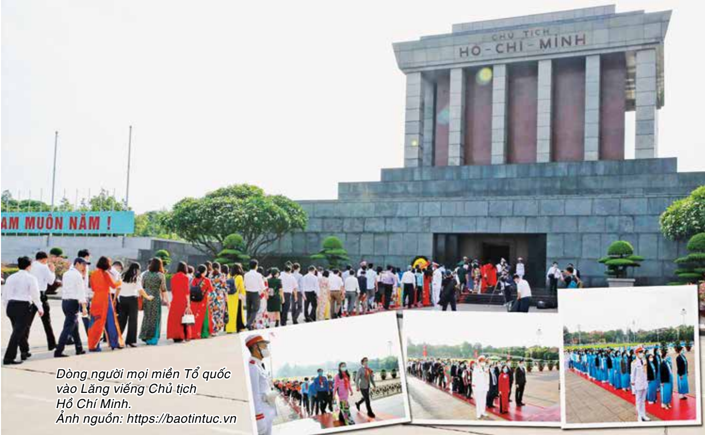
Dòng người mọi miền Tổ quốc vào Lăng viếng Chủ tịch Hồ Chí Minh.