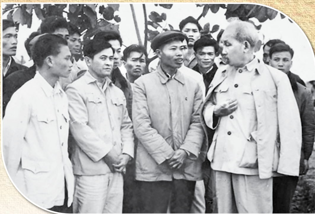
Bác Hồ thăm, trò chuyện với cán bộ và Nhân dân Hợp tác xã Phú Diễn, huyện Từ Liêm, Hà Nội ngày 31/01/1965.

“ Tài to ta dùng làm việc to, tài nhỏ ta cắt làm việc nhỏ, ai có năng lực về việc gì, ta đặt ngay việc ấy. Biết dùng người như vậy, ta sẽ không lo gì thiếu cán bộ ”