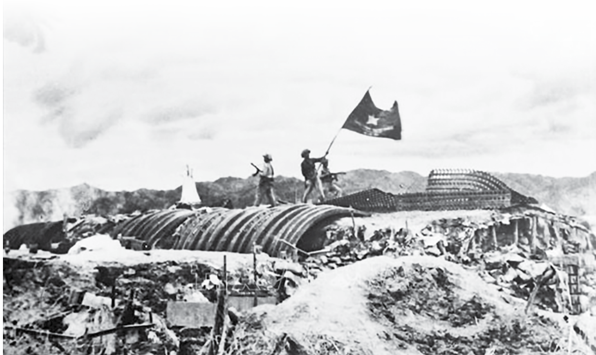
Chiều 07/5/1954, lá cờ “Quyết chiến - Quyết thắng” của Quân đội nhân dân Việt Nam tung bay trên nóc hầm tướng De Castries. Chiến dịch lịch sử Điện Biên Phủ đã toàn thắng.

Đảng Cộng sản Việt Nam quang vinh, về Chủ tịch Hồ Chí Minh vĩ đại đã lãnh đạo cách mạng Việt Nam vượt qua mọi sóng gió đi đến bến bờ vinh quang. Chiến thắng lịch sử Điện Biên Phủ mãi mãi là niềm tự hào, là nguồn sức mạnh to lớn cổ vũ toàn Đảng, toàn dân, toàn quân ta ra sức phấn đấu thực hiện thắng lợi Cương lĩnh xây dựng đất nước trong thời kỳ quá độ lên chủ nghĩa xã hội (bổ sung và phát triển năm 2011), Nghị quyết Đại hội đại biểu toàn quốc lần thứ XIII của Đảng, khơi dậy và hiện thực hóa khát vọng phát triển đất nước phồn vinh, hạnh phúc; phấn đấu đến giữa thế kỷ XXI, nước ta trở thành nước phát triển, theo định hướng xã hội chủ nghĩa •