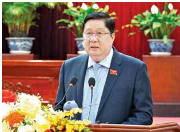
Đồng chí Phạm Văn Hiếu, Phó Bí thư Thường trực Thành ủy, Chủ tịch HĐND thành phố phát biểu bế mạc kỳ họp.

Ngày 09/4/2024, tại Hội trường Thành ủy Cần Thơ, Hội đồng nhân dân (HĐND) thành phố Cần Thơ khóa X, nhiệm kỳ 2021 - 2026 tổ chức kỳ họp thứ 14 (kỳ họp chuyên đề).