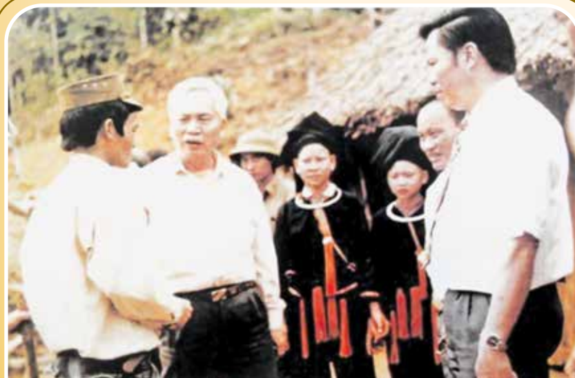
Đồng chí Đào Duy Tùng thăm tỉnh Yên Bái năm 1993.

Nhân kỷ niệm 100 năm Ngày sinh đồng chí Đào Duy Tùng (20/5/1924 - 20/5/2024), Ban biên tập Bản tin Thông báo hội bộ giới thiệu khái lược tiểu sử và quá trình hoạt động cách mạng của đồng chí Đào Duy Tùng theo tài liệu tuyên truyền của Ban Tuyên giáo Trung ương. Toàn văn Đề cương tuyên truyền kỷ niệm 100 năm Ngày sinh đồng chí Đào Duy Tùng mời các đồng chí xem tại mục “Tài liệu tuyên truyền” - Trang Thông tin điện tử Tuyên giáo Cần Thơ ( https://bantuyengiao.cantho.gov.vn ).