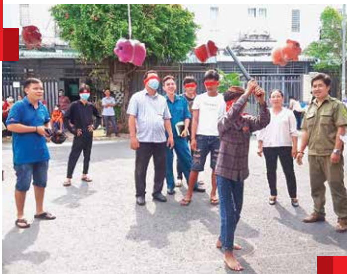
Các hoạt động văn hóa, văn nghệ, thể dục thể thao, trò chơi dân gian,... tại Ngày hội Đại đoàn kết toàn dân tộc ở khu dân cư luôn thu hút đông đảo người dân tham gia.

Ban Thường vụ Thành ủy đánh giá thời gian qua, các cấp ủy, tổ chức đảng và các cơ quan, đơn vị trong hệ thống chính trị thành phố đã lãnh đạo, chỉ đạo thực hiện tốt các chủ trương, quan điểm, chính sách, văn bản chỉ đạo của Đảng và Nhà nước về xây dựng khối đại đoàn kết toàn dân tộc, trong đó có việc tổ chức Ngày hội Đại đoàn kết toàn