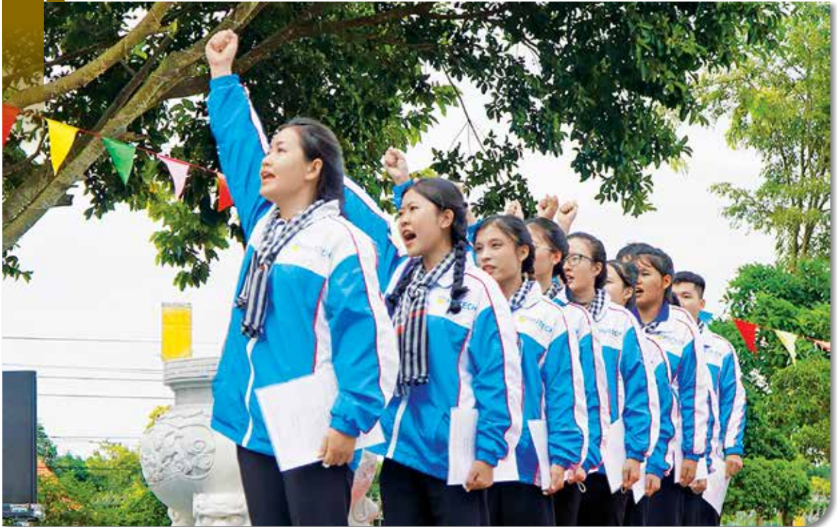
Sinh viên thực hiện nghi thức tuyên thệ trong lễ kết nạp đảng viên mới.