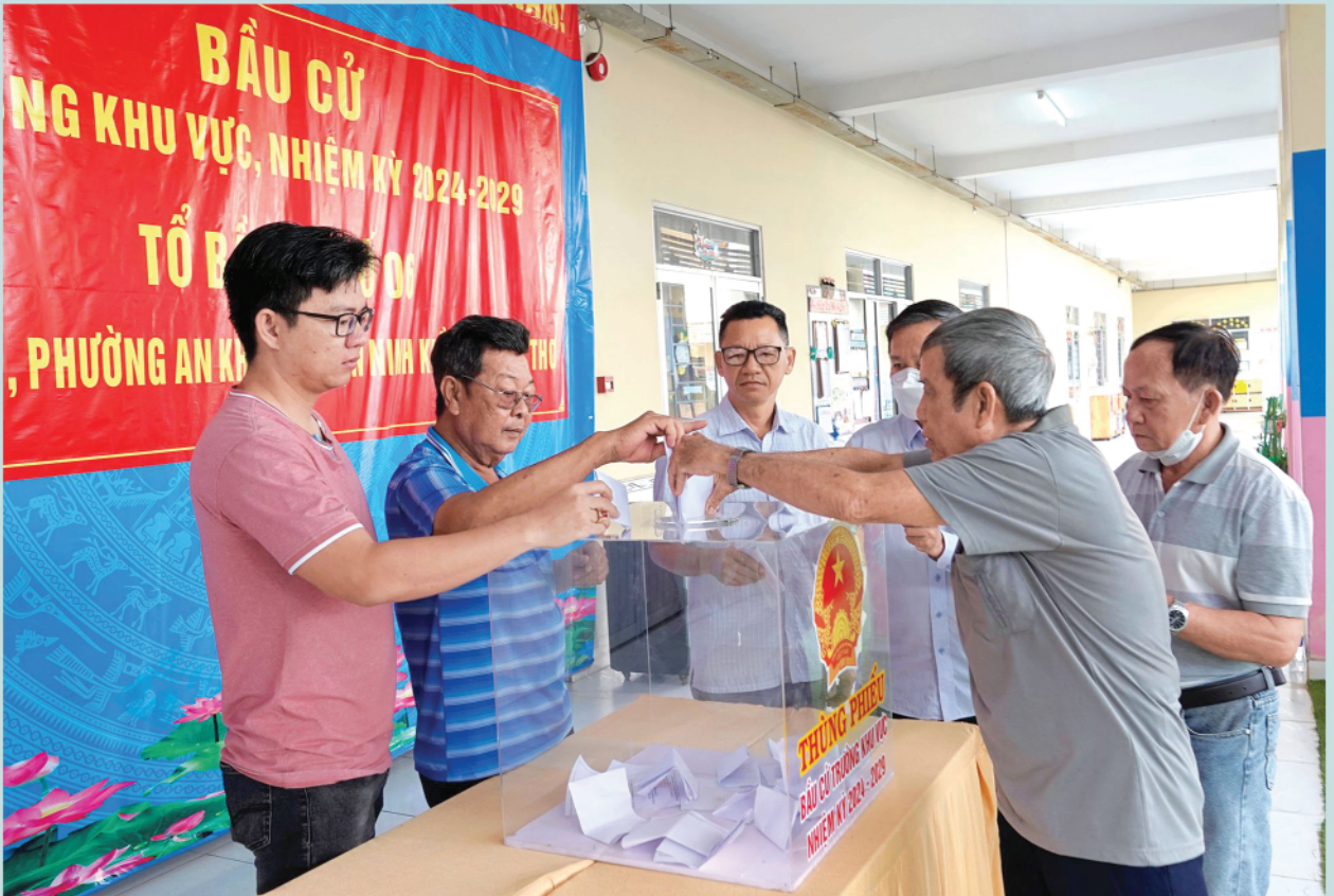
Các cử tri bỏ phiếu bầu Trưởng khu vực 6 (phường An Khánh, quận Ninh Kiều).