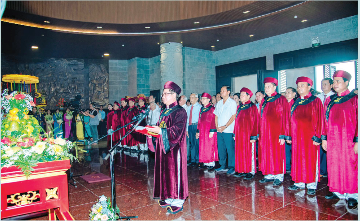
Ngày 18/4/2024 (nhằm mừng Mười tháng Ba năm Giáp Thìn), Đảng bộ, Chính quyền và Nhân dân thành phố Cần Thơ thành kính, trang nghiêm tổ chức Lễ Giỗ Tổ Hùng Vương, tại Đền thờ Vua Hùng thành phố Cần Thơ.