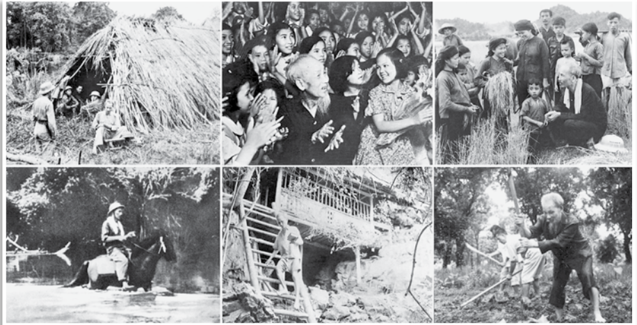
Càng giản dị ở cương vị cao nhất, Bác Hồ càng vĩ đại.

Từ buổi ra đi tìm đường cứu nước cho đến khi đi vào cõi vĩnh hằng, trải qua nhiều thập kỷ hoạt động cách mạng đầy sóng gió, chịu đựng biết bao hy sinh gian khổ, Chủ tịch Hồ Chí Minh đã chèo lái con thuyền cách mạng nước nhà đi từ thắng lợi này đến thắng lợi khác. Người đã khắc ghi vào lịch sử dân tộc những mốc son sáng chói trong các cuộc đấu đánh