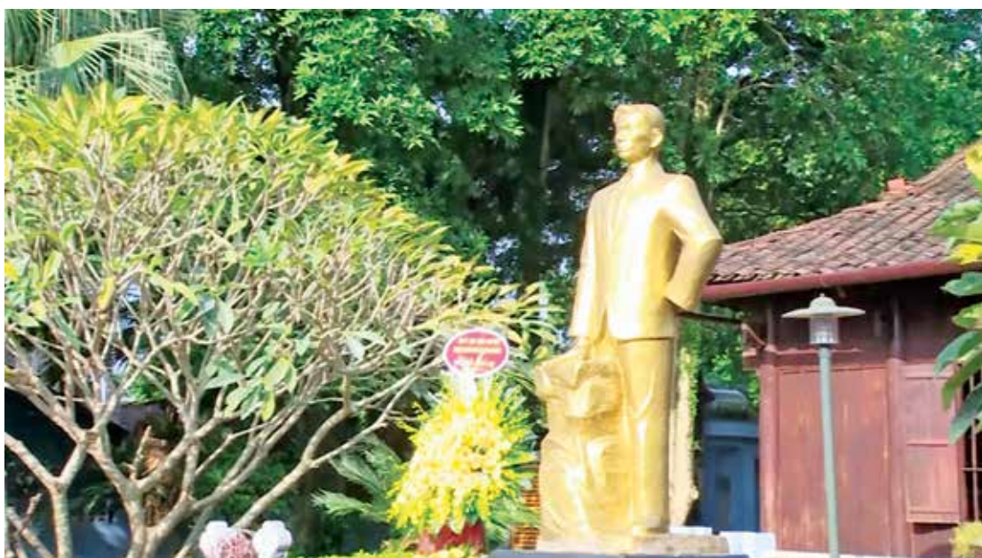
Tượng đồng chí Hoàng Đình Giông tại Khu lưu niệm đồng chí Hoàng Đình Giông được xây dựng tại xóm Nà Toàn, phường Đề Thám, thành phố Cao Bằng.